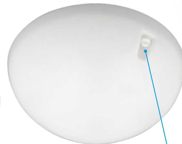
ULW-K20A / ULW-K20C